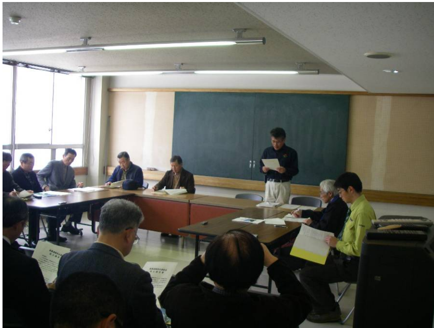
②設立趣旨書 読み上げ