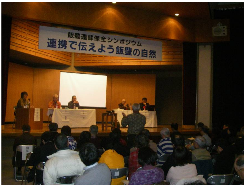
⑩会場からも意見があがった