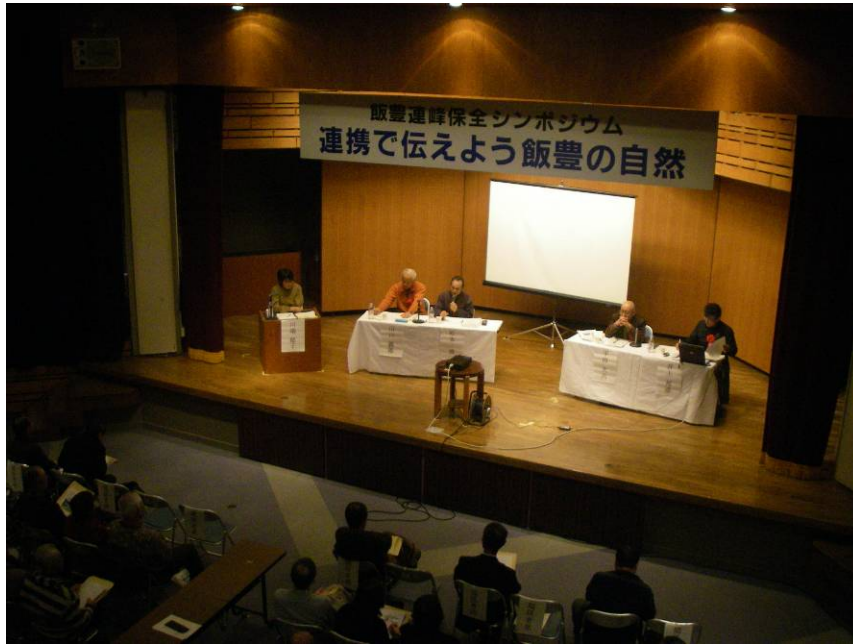
⑨パネルディスカッション2