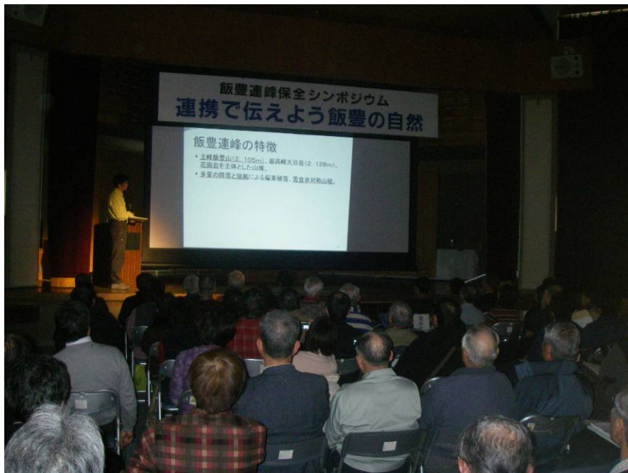
⑥ 飯豊連峰保全計画 検討の経緯