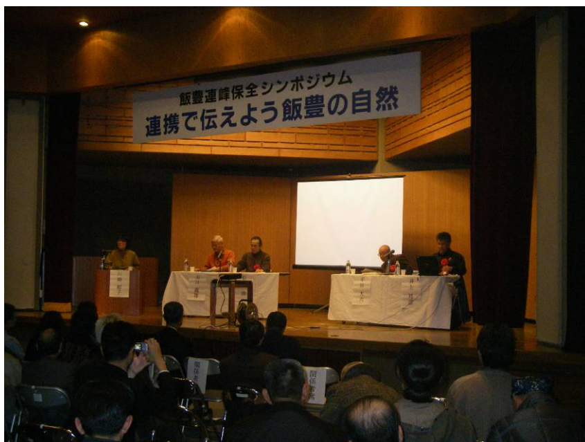
⑧パネルディスカッション1