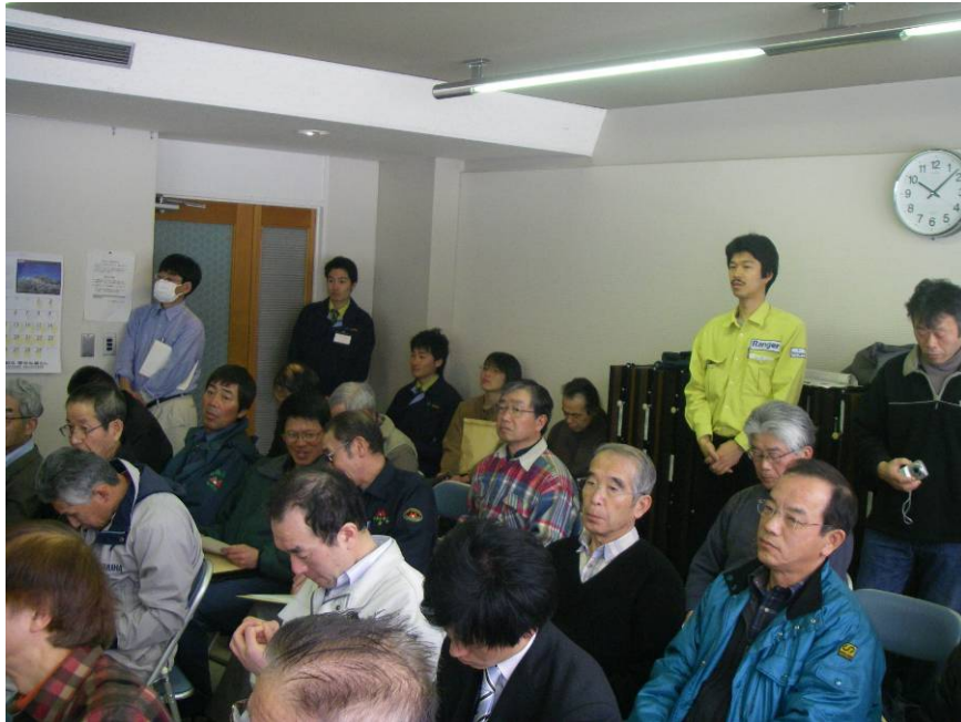
⑤多くの参加者が見守る中、連絡会の設立が承認された。