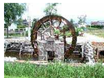
水車のある田園風景