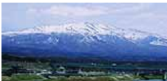
遊佐町は鳥海山の懷に抱かれた自然豊かな町です。