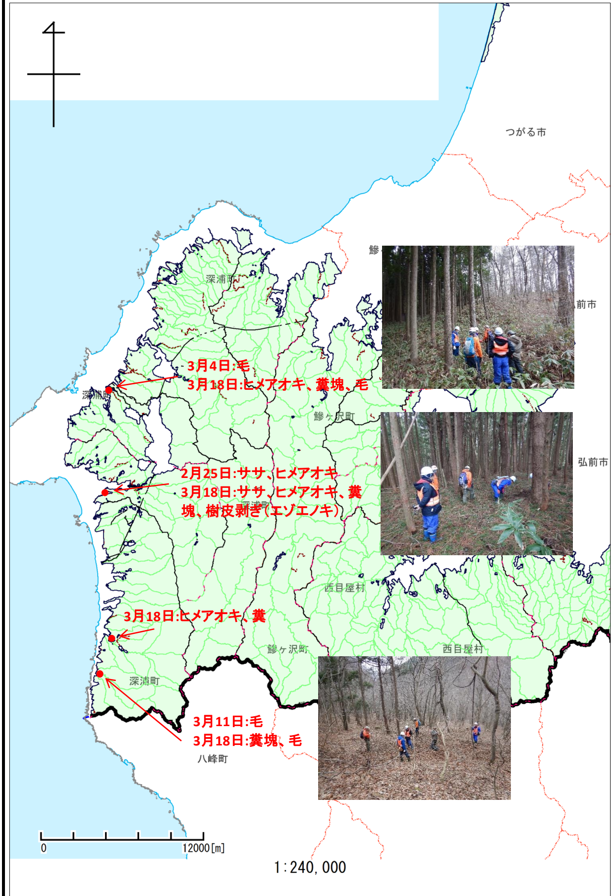
図1 令和2年度 冬期痕跡調査においてニホンジカの陽性反応が出た箇所