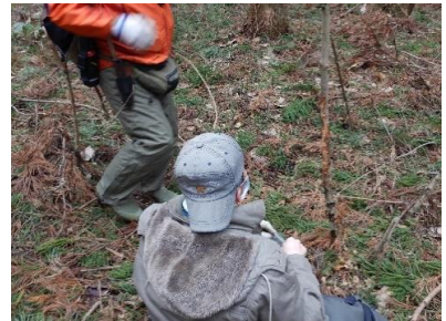
(3月18日：樹皮剥ぎ（エゾエノキ）)