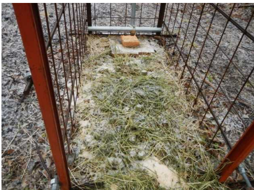
写真2 誘引剤設置状況