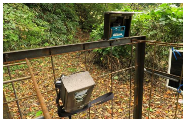
写真2 自動撮影装置取り付け状況