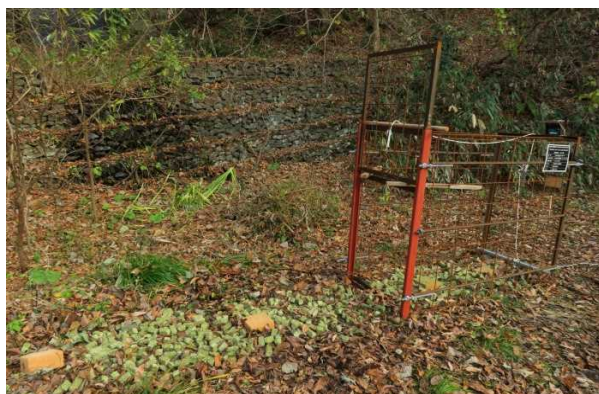
写真1 わな・誘引剤設置状況