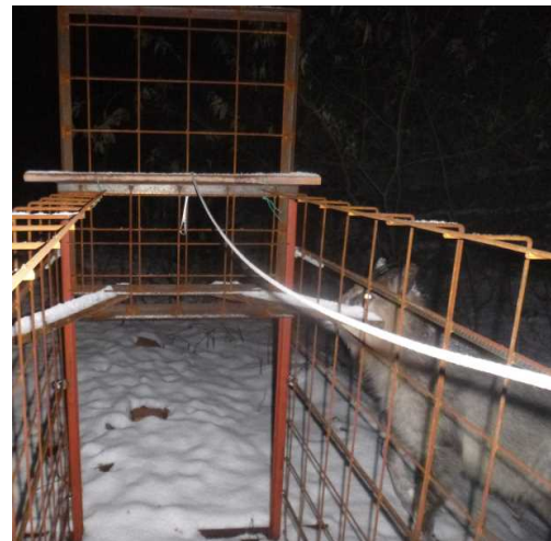
写真3 わなの脇を歩くカモシカ