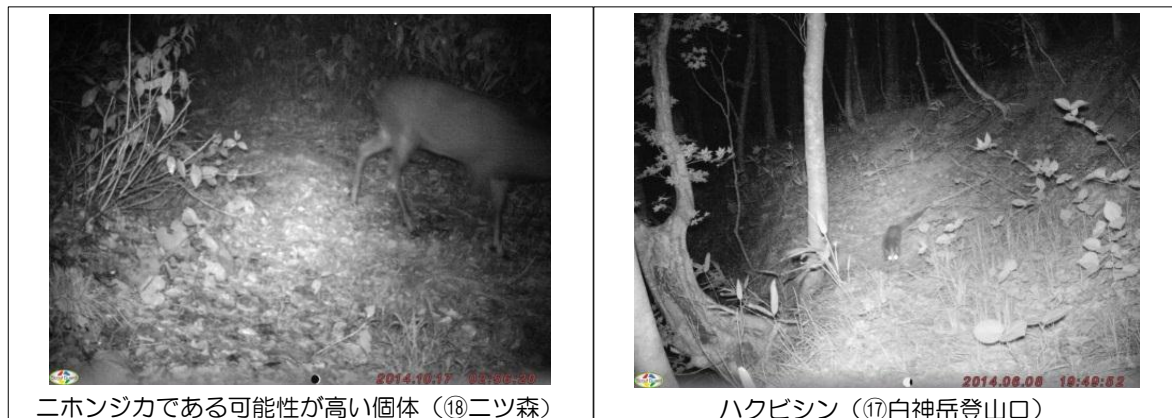
図2 自動撮影装置による生息域の拡大が懸念される種の撮影