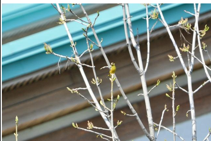
カワラヒワ：ピンクの嘴に、可愛い声で鳴きます。