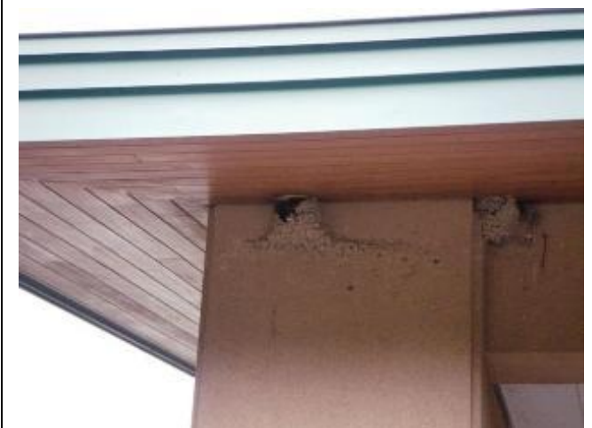
ツバメの巣：今年はスズメの親子が使っていました。