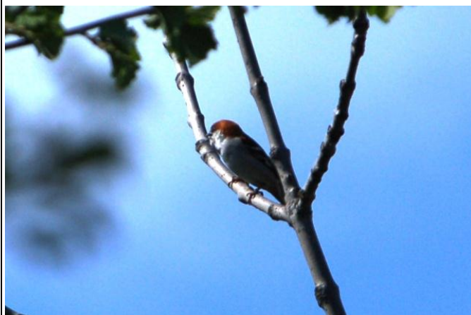
ニューナイスズメ：夏鳥。ほぼが白いです。