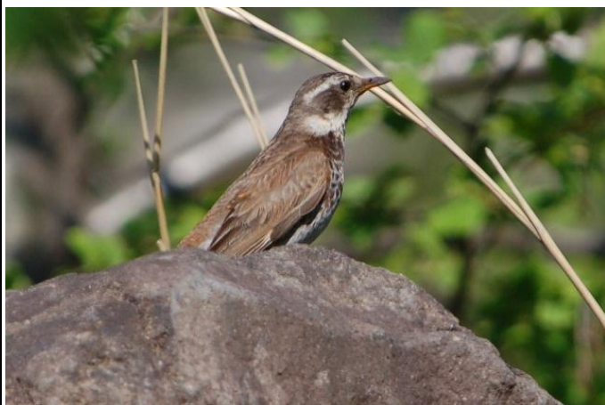
ツグミ：冬鳥。春にシベリアへ旅立ちます。

●コメント：春になり、鳥たちの声が聞こえてきたので世界遺産センター周辺でバードウォッチングをしました。まだ木々の葉も出そろっていませんでしたが、ゆっくり観察することができました。冬鳥もまだ残っていましたが、ツバメといった夏鳥も来始めていて春を感じました。