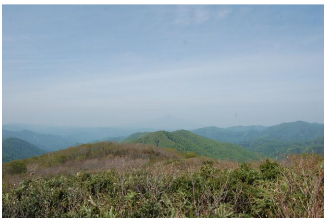
小岳山頂からの景色