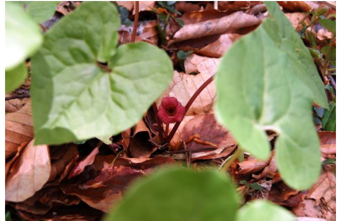
オクエゾサイシン