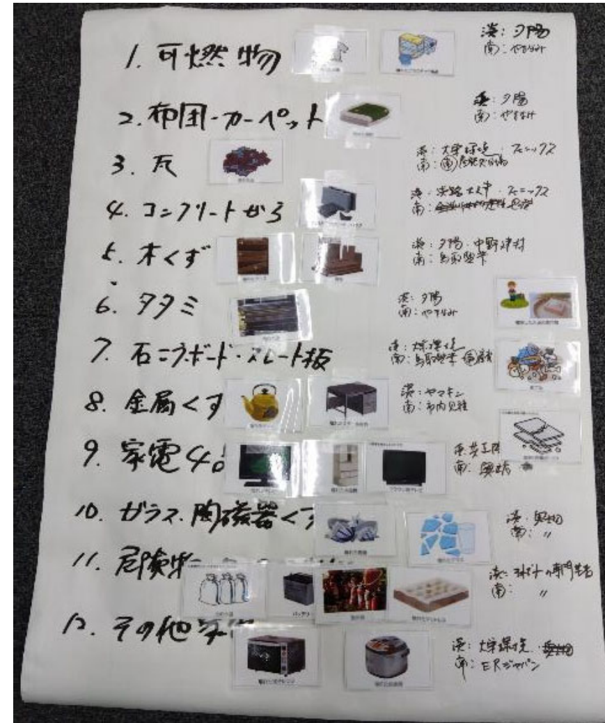
分別検討演習の例