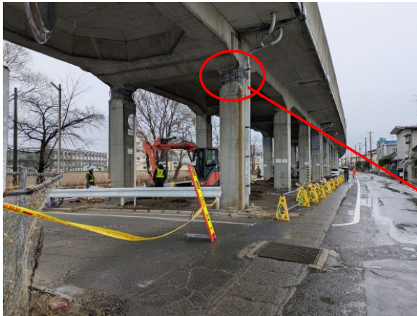
JR八戸線高架橋の損傷状況