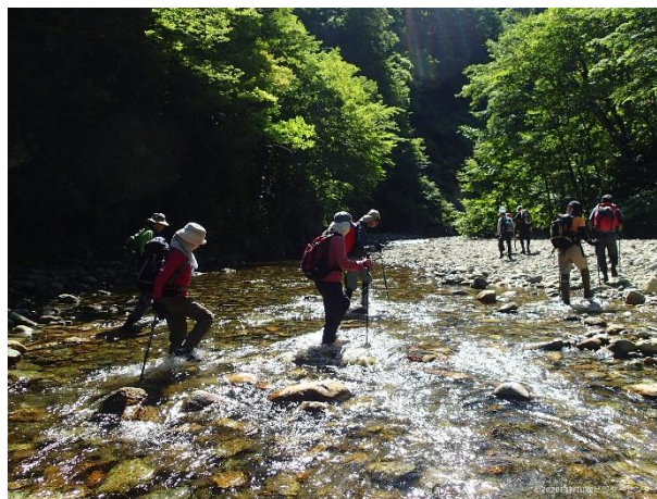
写真) 白神山地ビジターセンター