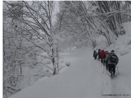
写真) 白神山地ビジターセンター