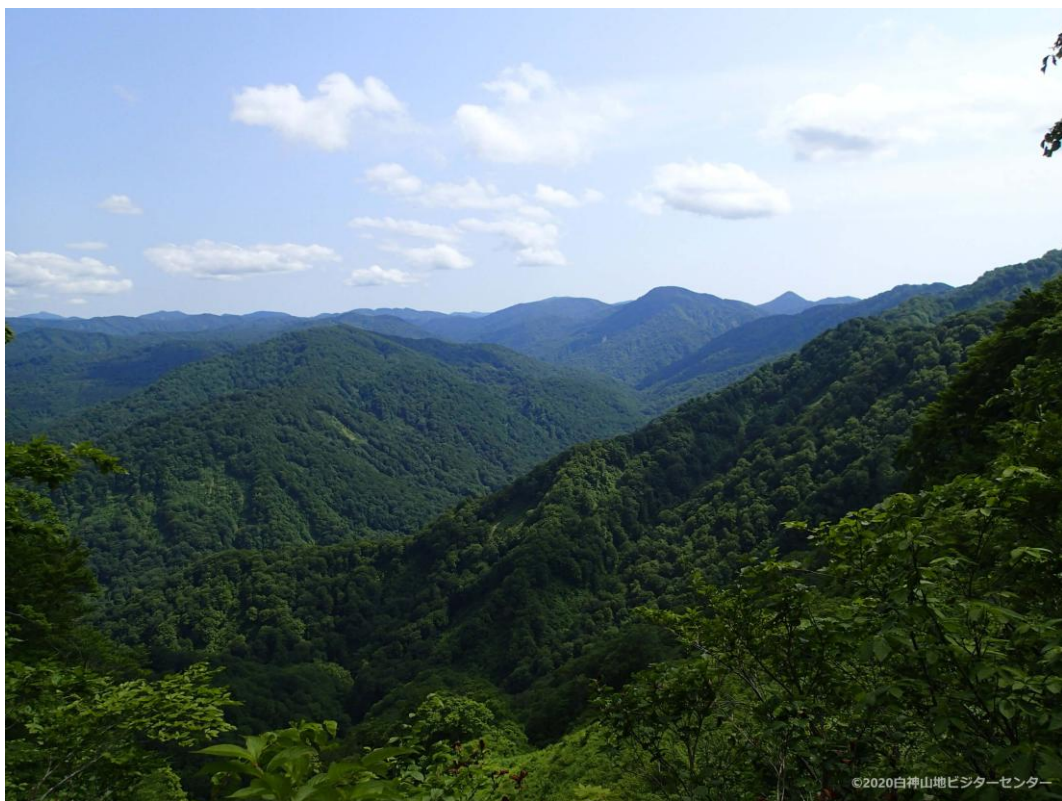
写真) 白神山地ビジターセンター

200万年におよぶ白神山地の形成期間、数千年におよぶ自然と人の共生の時間——この長い時間の積み重ねの上に、現在の白神山地と私たちの社会は存在しています。この悠久の流れの中で、私たち世代が生きる時間はごく一瞬に過ぎません。しかし、その一瞬の間に、私たちには、このかけがえのない白神山地の自然と、自然から生み出された文化を未来へと引き継ぐ役割があります。持続可能な社会をつくるため、あなたなら過去から培われてきた知恵をどのようなストーリーにして、未来に伝えていきますか。あなたのストーリーを私たちに聞かせてもらえたら、とてもうれしいです。