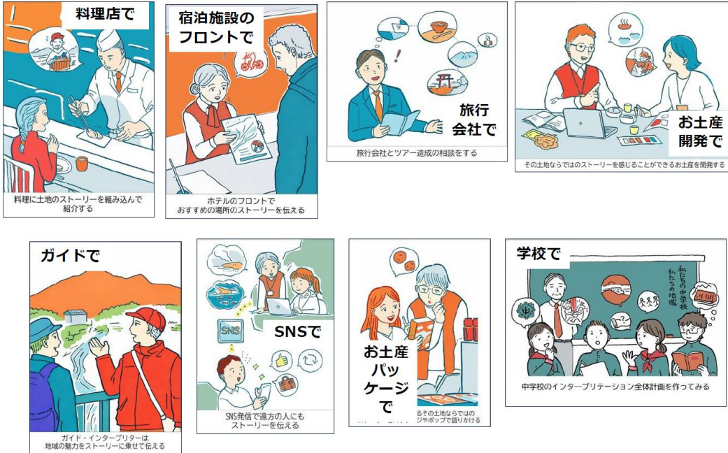
イラスト) 堀口治香氏