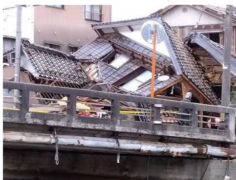
石川県穴水町 民家の被害 (1月5日)