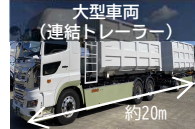
大型車両 （連結トレーラー） 約20m