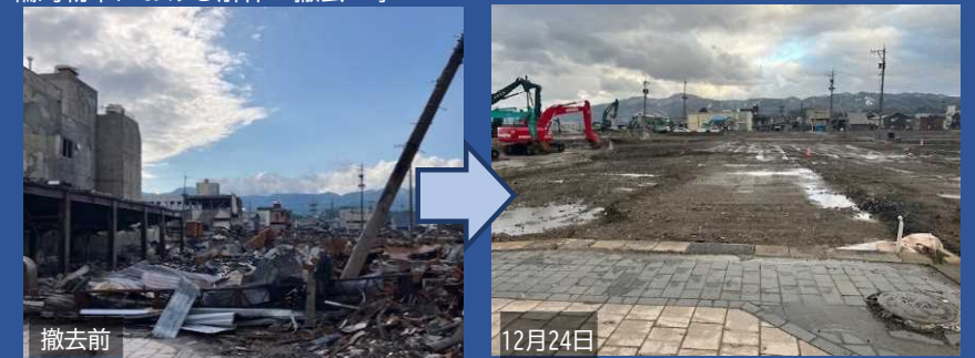
輪島朝市における解体・撤去工事