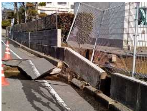
新潟県新潟市 路面の隆起 (1月2日)