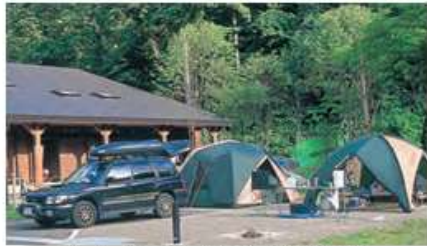
オートキャンプサイト (14区画)