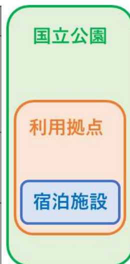
図1 各スケールにおける利用の高付加価値化の取組の例