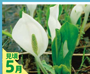
見頃 5月 ミズバショウ

花に見えるが仏炎苞は葉の変形したものである。仏炎苞の中央にある円柱状の部分は小さな花が多数集まった花序(かじょ)である。開花時期は低地では4月～5月、高地では融雪後の5月～7月にかけて。 葉は花の後に出る。根出状に出て立ち上がり、長さ80cm、幅30cmに達する。