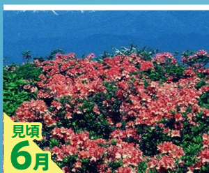
見頃 6月 レンゲツツジ

花に見えるが仏炎苞は葉の変形したものである。仏炎苞の中央にある円柱状の部分は小さな花が多数集まった花序(かじょ)である。開花時期は低地では4月～5月、高地では融雪後の5月～7月にかけて。 葉は花の後に出る。根出状に出て立ち上がり、長さ80cm、幅30cmに達する。