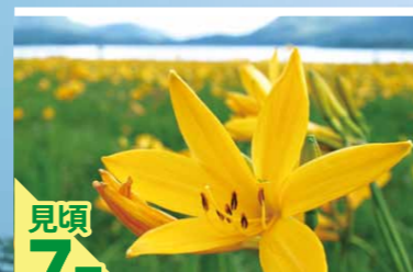
見頃 7月 ニッコウキスゲ

高さ30～50cm。花期は5月～6月。白い綿毛を付ける果期は6月～8月。花が終わると直径2～3cmの名前の由来ともなっている白い綿毛を付ける。この綿毛は種子の集まりである。