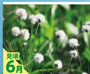
見頃 6月 ワタスゲ

高さ1～2mの落葉低木、4～6月に葉が出たのち葉が開くのと前後して直径5cmほどのロート状の花をつける。果実は蒴果、長さ2～3cmの円筒状で、10～11月に熟すると5裂して小さな種子を飛ばす。つぼみの様子が蓮華に見えることから名付けられたという。