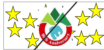
強烈な背景(写真を含む)との組み合わせ