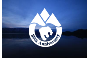
写真背景 / 白抜き