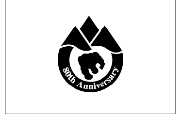
白地背景 / モノクロ