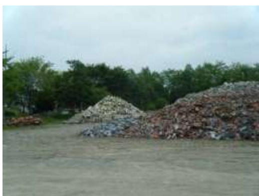
分別保管された屋根瓦(手前) (利府町)