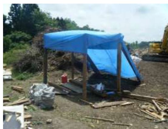
作業現場付近に設けられた休息所 (柱はガレキの一部を有効利用)