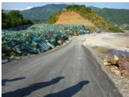
ネットで覆われた災害廃棄物 (岩手県大船渡市)

岩手県大船渡市では、紙ごみやプラスチックごみなどの敷地外への飛散防止を図ることを目的として、仮置場にフェンスを設置するとともに、保管された災害廃棄物全体をネットで覆っています。また、岩手県田野畑村では仮置場の周囲に十分な高さのフェンス(3m)を設置し、ごみの飛散防止を図るとともに、仮置場区画の明確化、外部からの侵入防止を図っています。