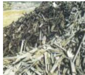
水槽分離された木くず