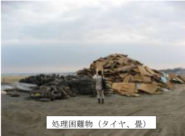
処理困難物（タイヤ、畳）