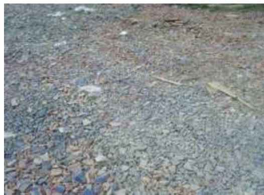
屋根瓦で覆われた仮置場敷地 (宮城県七ヶ浜町)