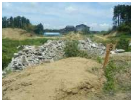
分別保管された屋根瓦(左)及びコンクリートガラ(右) (松島町)