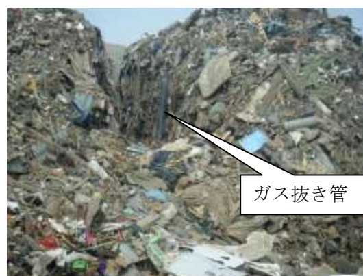
混合物の山に設置されたガス抜き管