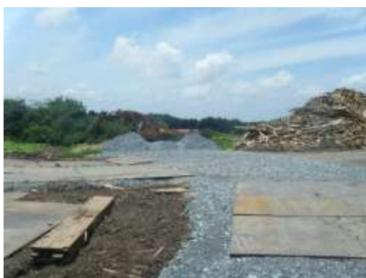
仮置場搬入路に敷設された砂利・鋼板 (宮城県松島町)

宮城県松島町では、仮置場の搬入路に鉄板や砂利などを敷くことにより乾燥時における粉じんの飛散を防止する取組がなされています。また、宮城県七ヶ浜町では、砕いた屋根瓦を仮置場敷地内に敷設して同様の効果を得ています。