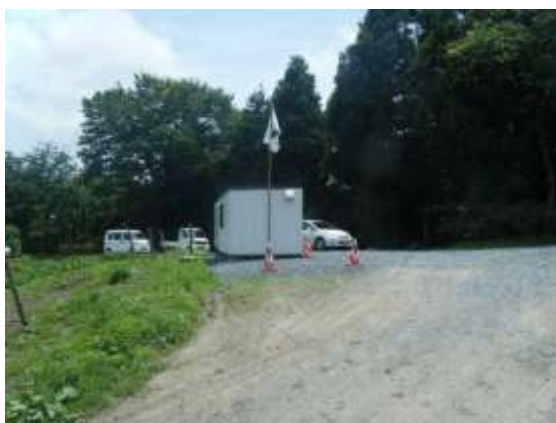
仮置場入口付近に設けられた待機所

宮城県松島町では、仮置場の入口付近に現場作業従事者が待機、休息するためのプレハブ小屋を設置し、水分補給を行うための設備、救急医療器具・薬品及び手を洗う等の清潔維持のための設備を備えています。待機所には安全旗を掲揚して、作業従事者に対して安全作業遵守を喚起しています。加えて、作業現場付近に、直射日光を避けつつ、短時間の休息を取ることと併せ水分補給を行うための設備を設けています。内部には、眼への異物混入、怪我をした際の傷口洗浄のためのペットボトル、ポリタンクの水等を備えています。