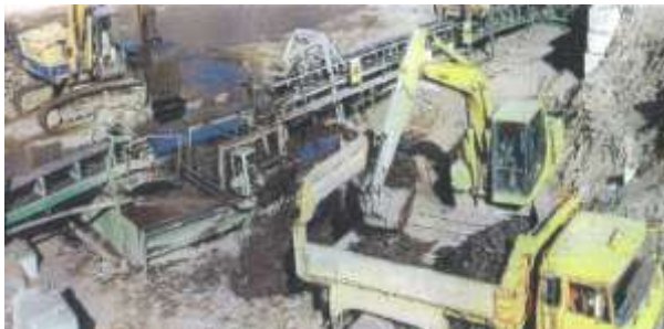
水槽分離施設での作業の様子

当該取組は、木くずの有効な選別方法として、災害廃棄物の現地での適切な選別作業に大きく貢献しました。