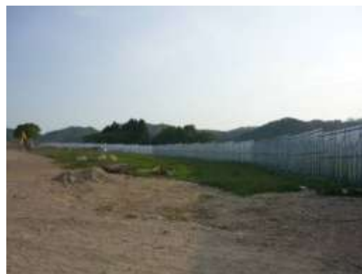
仮置場周囲に設置されたフェンス (岩手県田野畑村)