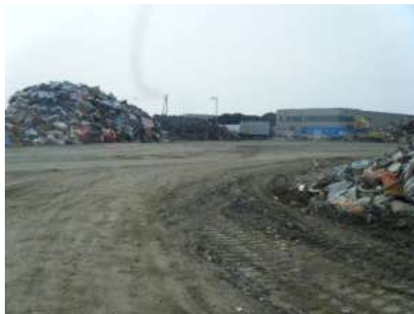
東松島市の自動車用タイヤの仮置場

宮城県東松島市では、仮置場における自動車用タイヤの搬出をほぼ毎日行い、保管期間を最小限に留めることにより、蚊の発生防止の取組を行っています。