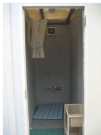
設置されたシャワールーム(写真左)とその内部(写真右)