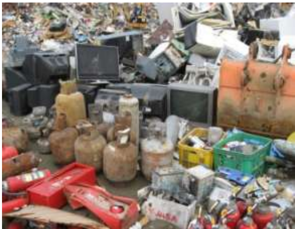
危険物（ガスボンベ、消火器類）