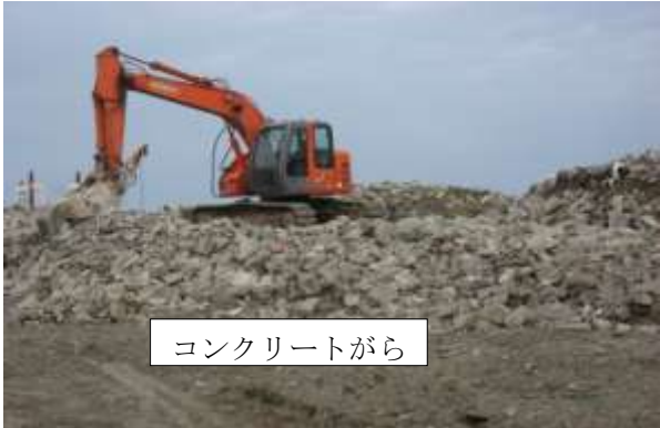
コンクリートがら