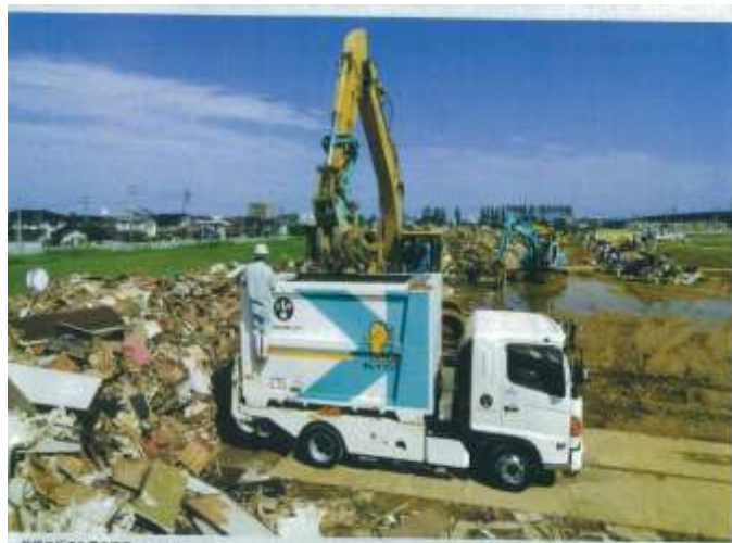
松崎町総合センターで