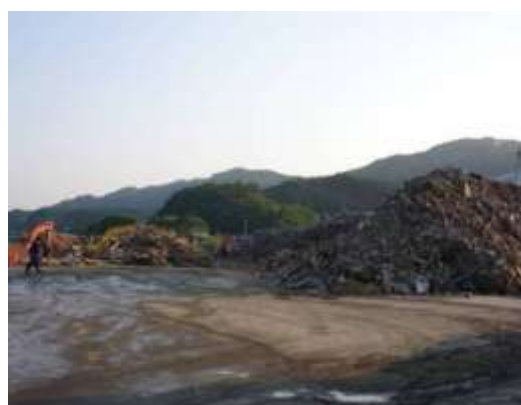
ヤード毎に確保された作業スペース