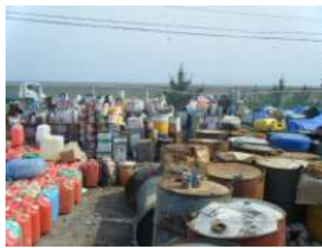
分別保管されたポリタンク(手前)、石油 ストーブ及び燃料タンク等(奥)(東松島市)