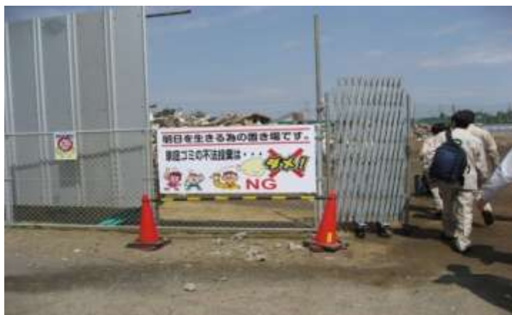
千葉県旭市仮置場ゲート入口の注意看板 不法投棄禁止の注意喚起