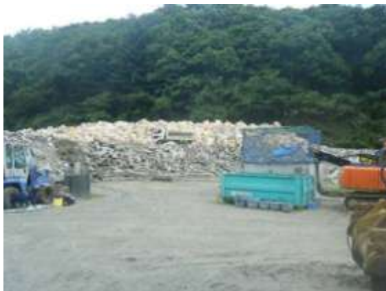
フレコンパックを用いて保管された肥料

なお、飼料、肥料の防湿を図る手段としては、このほか、保管場所の屋根の設置やブルーシート等による養生が考えられますが、この場合、水溜まりの発生防止や強風時における飛散防止のための対策を講じる必要があります。