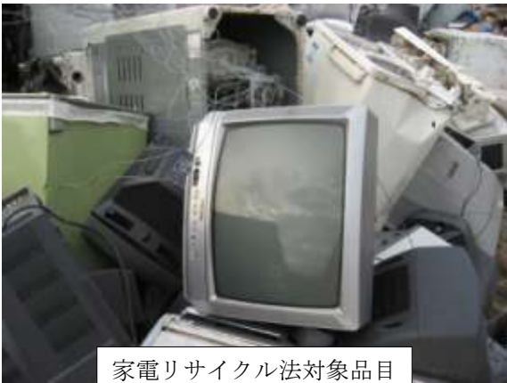
家電リサイクル法対象品目