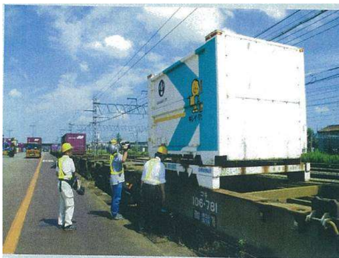
南長岡駅から鉄道で川崎へ

阪神・淡路大震災、中越沖地震においては、鉄道貨物輸送による廃棄物の広域輸送を実施し、遠隔地での受入処理を確保する取組を実施しています。