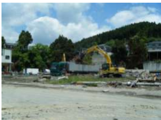
発生現場で直接荷積みされるスクラップ (南三陸町)

宮城県南三陸町などでは、金属類を発生現場で直接荷積みし、早期に売却を進めることにより、仮置場容量の確保を図っています。また、岩手県山田町では、木材チップの搬出先を早期に確保することで、仮置場における廃木材の分別とチップ化を先行的に実施することが可能となり、継続的なチップの搬出が可能となっています。