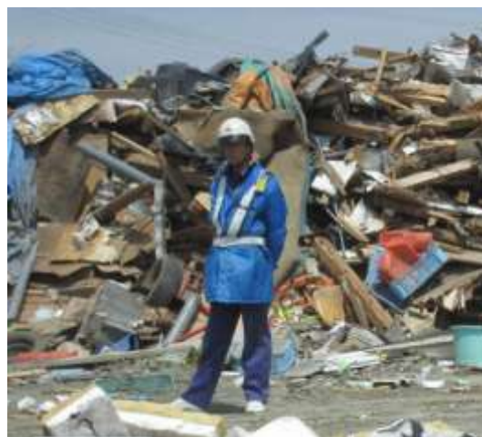
盗難防止のためのガードマン