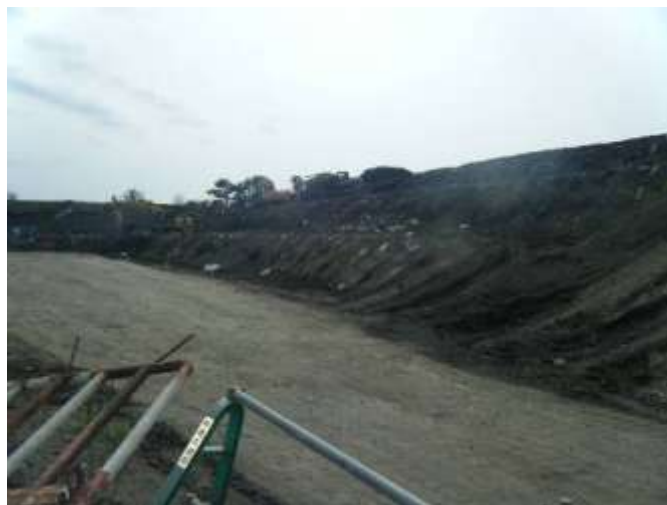
土壌改良され保管された津波堆積物

宮城県東松島市では、これまで市街地の側溝の津波堆積物の撤去について、関係者で役割分担（蓋上げは地区住民、清掃作業はボランティア、運搬は市が雇上した建設業者）をすることで進められてきました。今後、市は、土木業者と連携して、津波堆積物の性状調査、セメント添加(3%程度)による土壌改良試験、ストックヤードの確保を行うことにより、津波堆積物の埋戻し材としての有効利用の道を模索しています。