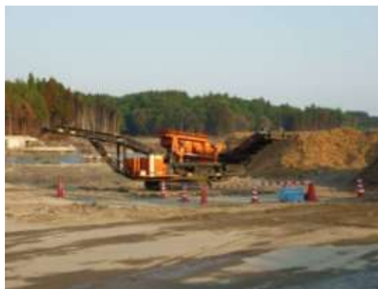
チップ化された廃木材 (山田町)