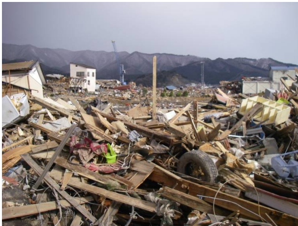
津波により被災した大船渡市街