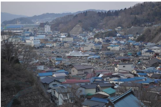
宮古市内 鎌ヶ崎 浄土ヶ浜大橋より