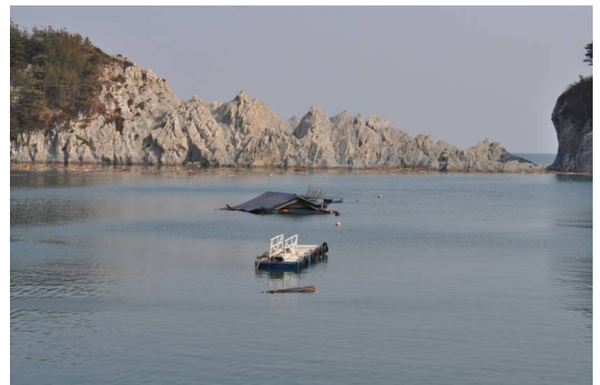
浄土ヶ浜に流れ着いた屋根