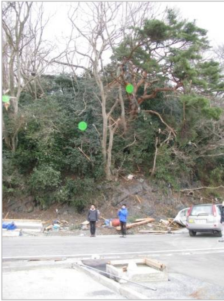
津波により木にかかった漁具