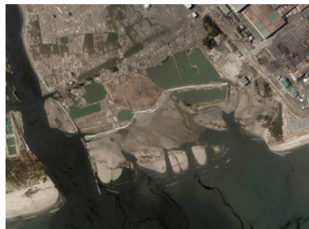
蒲生干潟震災後