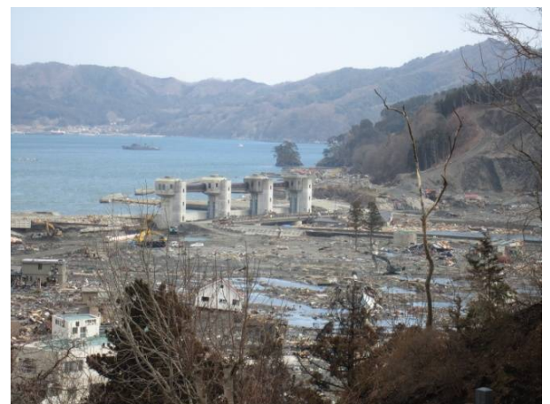
壊滅的な打撃を受けた大槌町