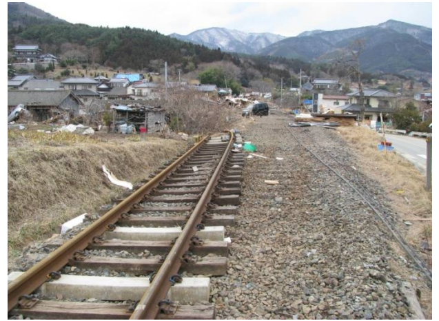
津波に流された線路