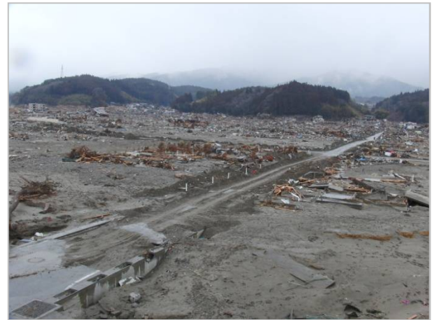
津波により被災した陸前高田市街