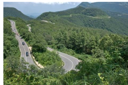
磐梯吾妻スカイライン