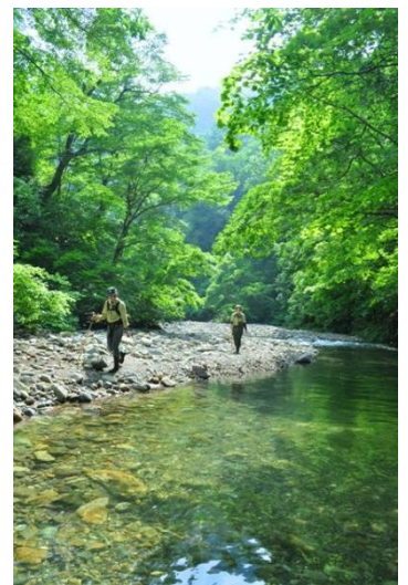
「巡視風景」_大川 (西目屋自然保護官事務所 アクティブレンジャー 谷口 哲郎)