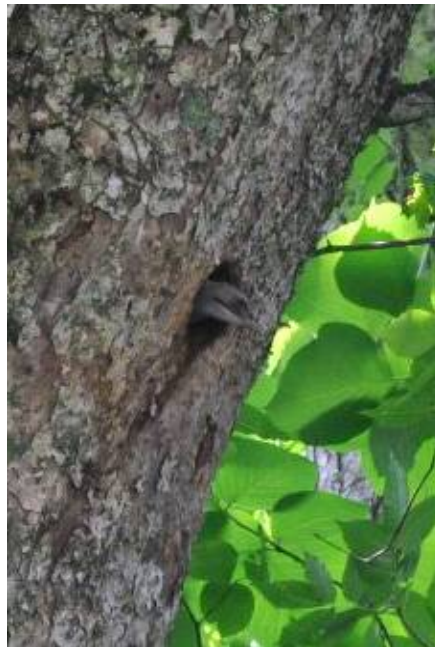
「こんにちは」_アオゲラ (西目屋自然保護官事務所 アクティブレンジャー 谷口 哲郎)