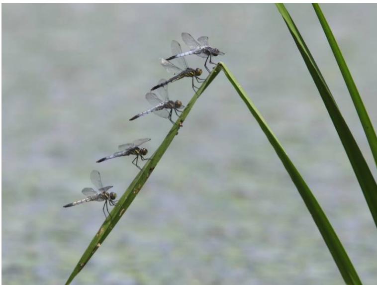
整列！シオカラトンボ_伊豆沼 (仙台自然保護官事務所 アクティブレンジャー 鎌田 和子)