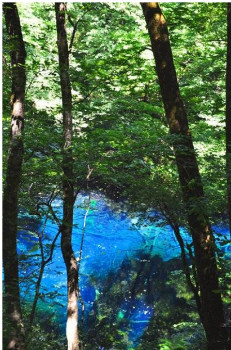
「青」十二湖 (西目屋自然保護官事務所 アクティブレジャー 谷口 哲郎)