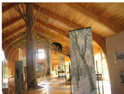
森吉山野生鳥獣センター内

また、この期間に、森吉山野生鳥獣センター運営協議会では森吉山麓の名勝地などを多くの人に紹介し、自然の大切さ・環境への関心を抱いてもらうため月1回自然観察会を実施しております。どうぞお気軽にご参加ください。