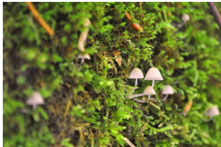
「森のランプ」暗門ブナ林散策歩道 (西目屋自然保護官事務所 アクティブレジャー 谷口 哲郎)