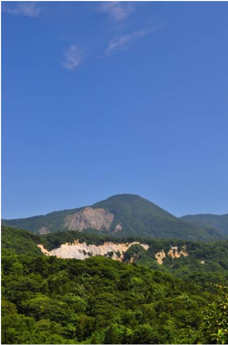
「快晴」_十二湖日本キャニオン (西目屋自然保護官事務所 アクティブレンジャー 谷口 哲郎)