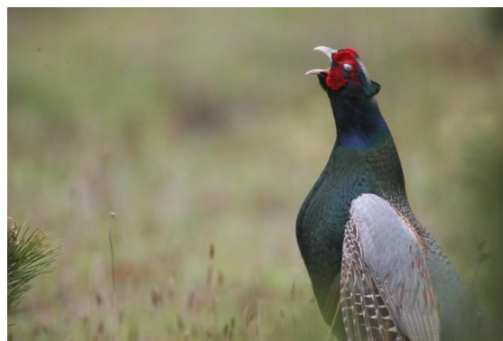
轟け！！ (秋田自然保護官事務所 アクティブレジャー足利直哉)