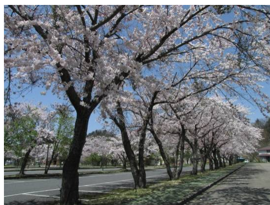
やっと咲きました (十和田自然保護官事務所 アクティブレジャー種村由貴)