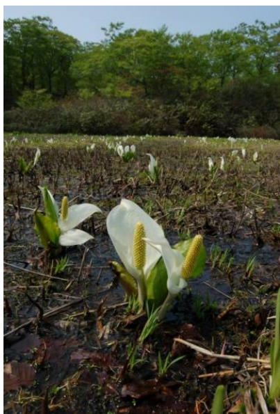
田苗代湿原に咲く春(ミズバショウ)