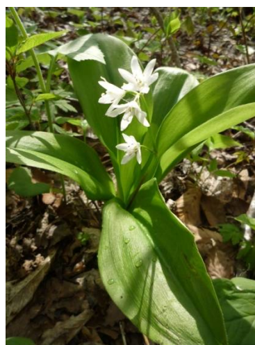
早咲きツバメオモト (十和田自然保護官事務所 アクティブレジャー種村由貴)