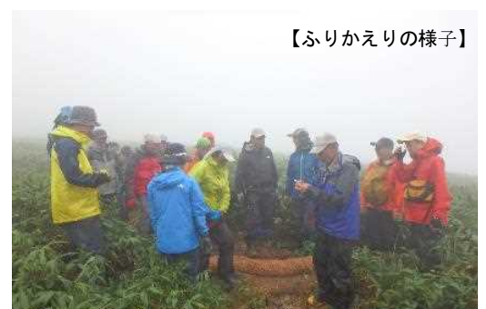
【ふりかえりの様子】