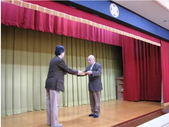
【表彰状授与式の様子】

当会の活動が多年にわたり自然歩道の維持 管理 適正利用の推進 普及啓発活動等に大きく貢献したことに對し、環境省自然環境局長より自然歩道関係功労者表彰を受賞したことが報告されました。なお、表彰状の授与については、本会合に先立って幹事会（平成 27 年 12 月 19 日）において行われました。