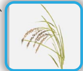
農産品の品質低下