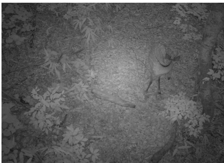
鱒ヶ沢町において撮影されたニホンジカ