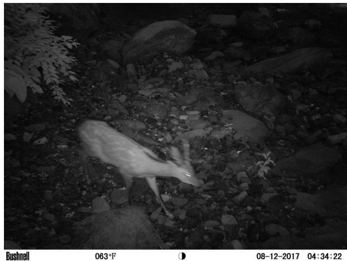
深浦町において撮影されたニホンジカ

* 新聞、テレビ放映で使用される場合、電子データを提供致します。提供を希望される場合は、下記の問い合わせ先へ電子メールを送付下さい。